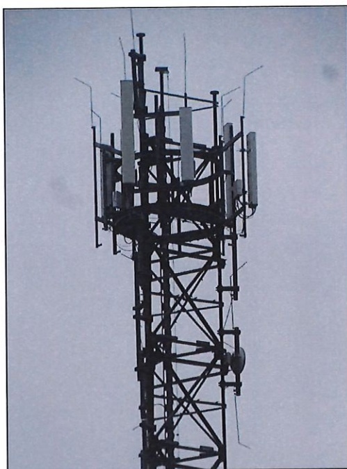
Rys. 4 Widok badanego obiektu