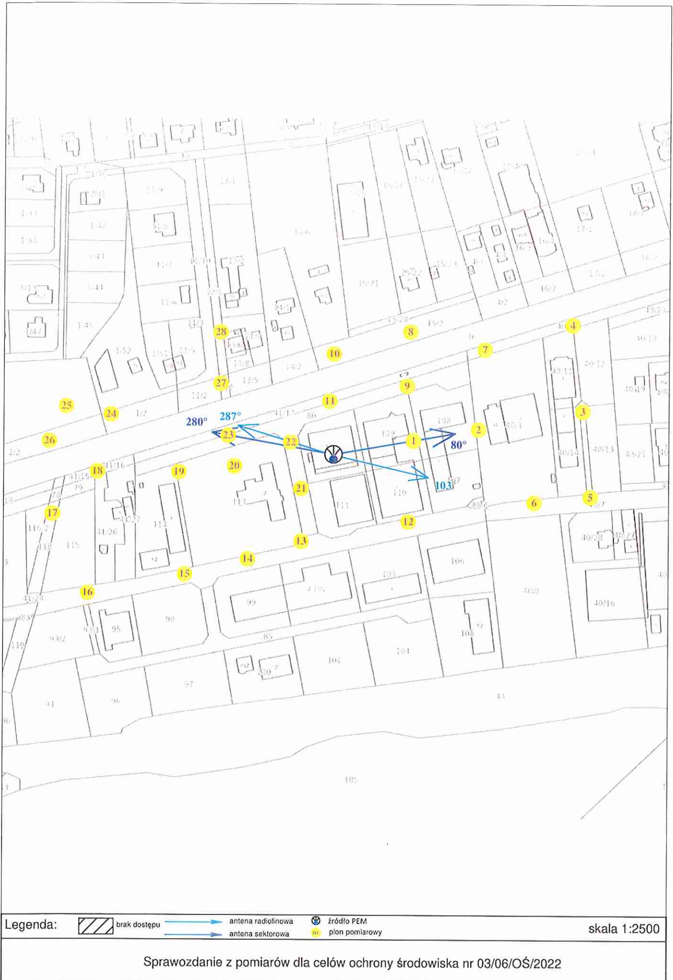
Rys. 2 Lokalizacja pionów pomiarowych