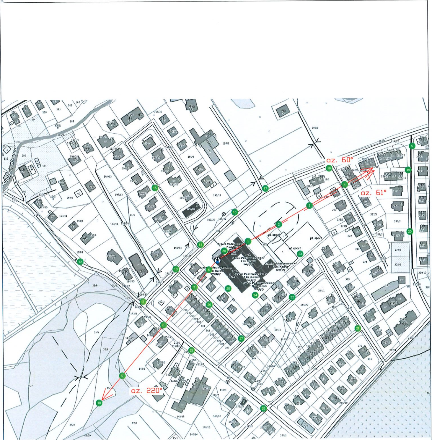
Rys.1 Lokalizacja pionów pomiarowych